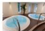
35 VOLAREZA Bedřichov Whirpooly.jpg