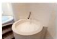
33 VOLAREZA Bedřichov - ledová tříšť.jpg