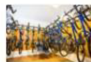
48 VOLAREZA Bedřichov půjčovna kol .jpg