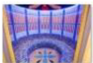
32 VOLAREZA Bedřichov - parní solná sauna.jpg