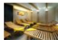
36 VOLAREZA Bedřichov odpočinková část.jpg