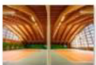
44 VOLAREZA Bedřichov - tenisová hala.jpg