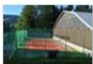
45 VOLAREZA Bedřichov - tenisový kurt.jpg