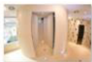
31 VOLAREZA Bedřichov sprchy a parní sauna.jpg