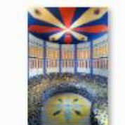
30 VOLAREZA Bedřichov parní solná sauna