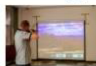
47 VOLAREZA Bedřichov střelecký trenažér.jpg