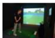
46 VOLAREZA Bedřichov - sportovní trenažér.jpg