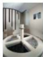
34 VOLAREZA Bedřichov Kneippův chodník.jpg