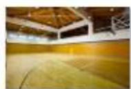
43 VOLAREZA Bedřichov - tělocvična.jpg