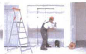
Servis 24 hodin