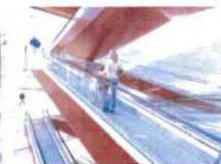
Eskalátory & pohyblivé chodníky