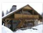
19 VOLAREZA Bedřichov - restaurace U Medvěda