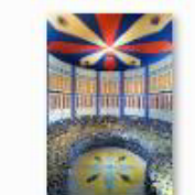
30 VOLAREZA Bedřichov parní solná sauna