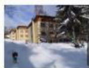
3 VOLAREZA Bedřichov - depandance zima