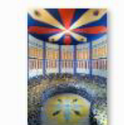
30 VOLAREZA Bedřichov parní solná sauna