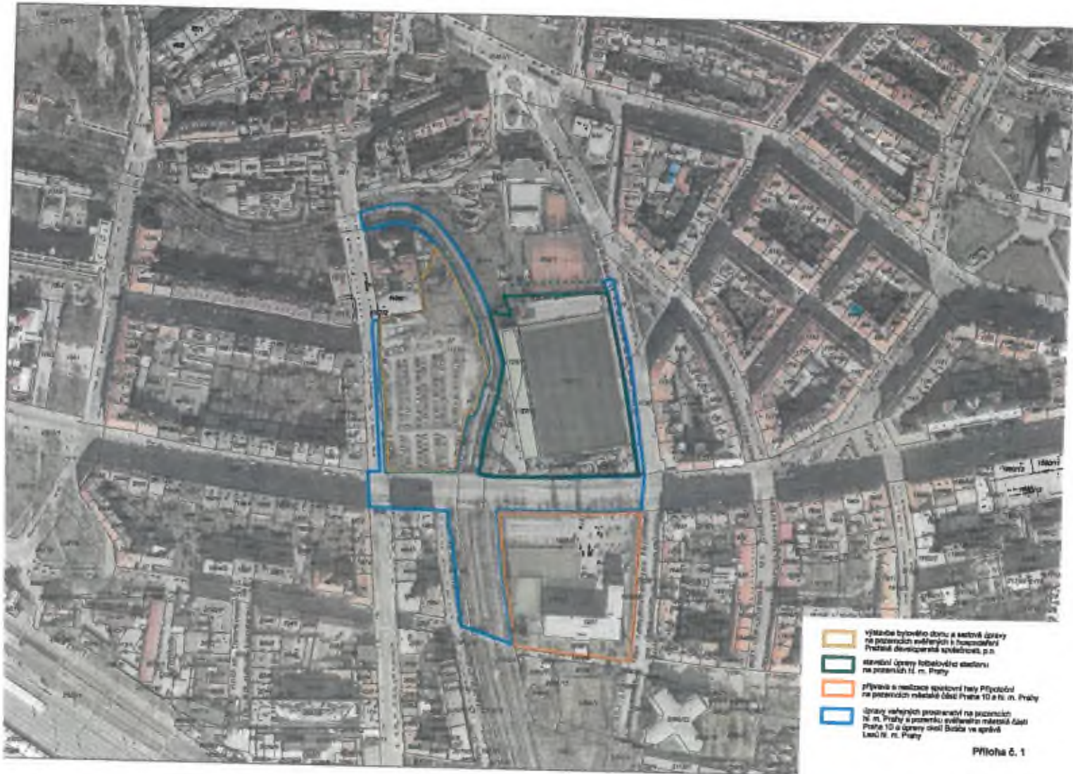
Příloha č. 1