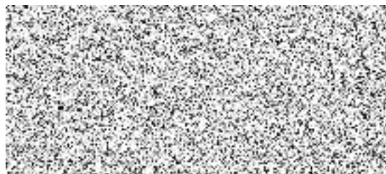
GEOSAN GROUP a. s.