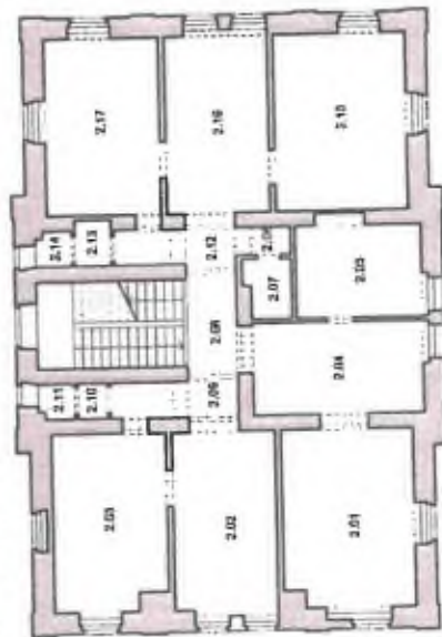
Schematický půdorys 1.PP