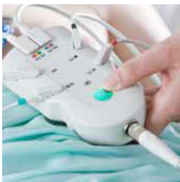
Digitální patientský modul (PIM)