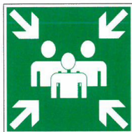
Tabulka označení místa shromaždiště osob

Evakuace začíná po nechráněných únikových cestách (tj. všechny spojovací komunikace v jednotlivých podlažích). Nechráněné únikové cesty vedou do chráněných únikových cest (tj. např. hlavní schodiště, případně sousední požární úseky) do směru únikové cesty a místa dočasného soustředění (tzv. shromaždiště osob ).