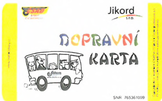
Vzor Dopravní karty