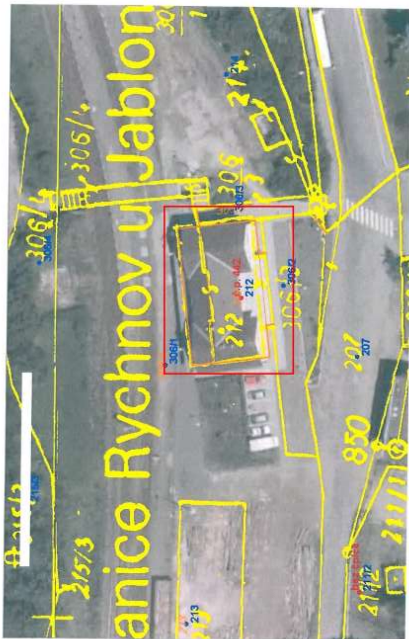
Příloha č.1a) Kopie katastrální mapy