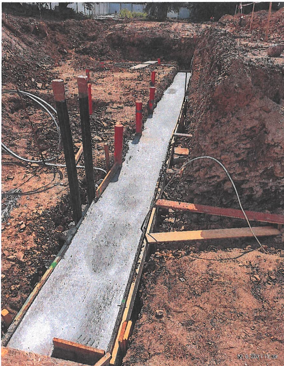
OBR 1 - SO 02 - rýha vč. betonového pasu