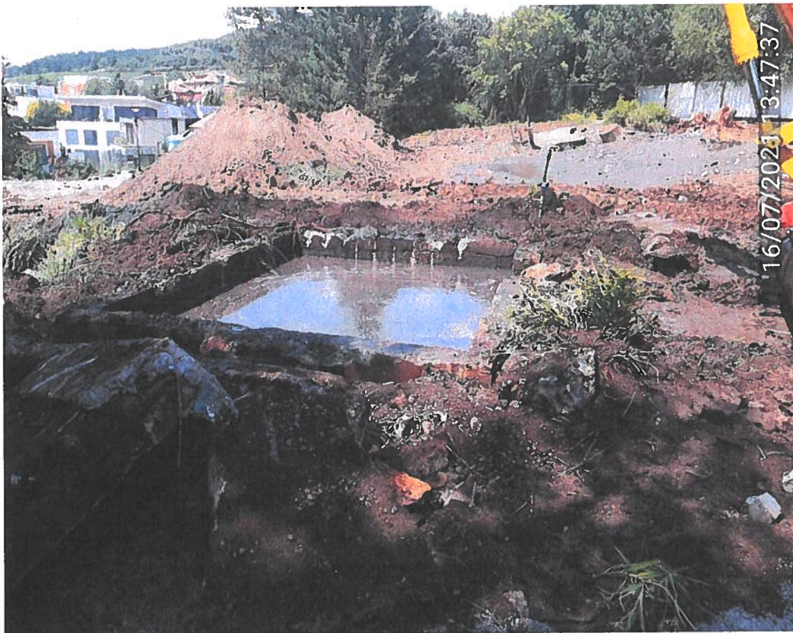
OBR 1 - jímka - skleník