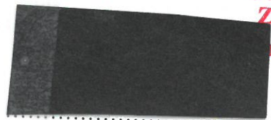
Ing. Jiří Šlachta ředitel odboru vnitřní správy Mze (předávající)

MINISTERSTVO ZEMĚDĚLSTVÍ Těšnov 65/17 10 00 Praha 1- Nové Město -103-