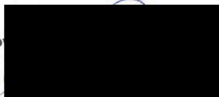
Radek Štecker obchodní ředitel a jednatel

MĚSTO PŘELOUČ MASARYKOVO NÁMĚSTÍ 25 535 33 PŘELOUČ IČO:00 274 101 DIČ:CZ00274101 -3-