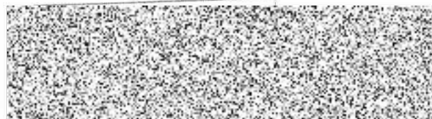
ZŠ a OŠ Horšovský Týn za Objednatele