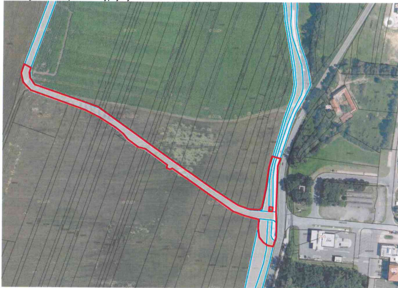
Letecký snímek: předmět výpůjčky ohraničen červeně