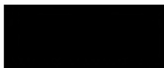
Zhotovitel Severočeské vodovody a kanalizace, a.s.