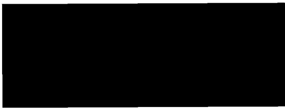
Severočeské vodovody a kanalizace, a.s. [redacted] ředitel rozvoje a investic Objednatel