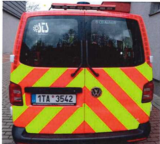
Ilustrační foto požadovaného barevného provedení