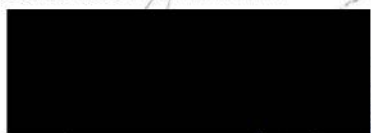
Irena Michalcová starostka MČ Praha 4