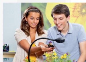
Projektory a vizualizéry