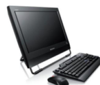
Výpočetní a kancelářská technika