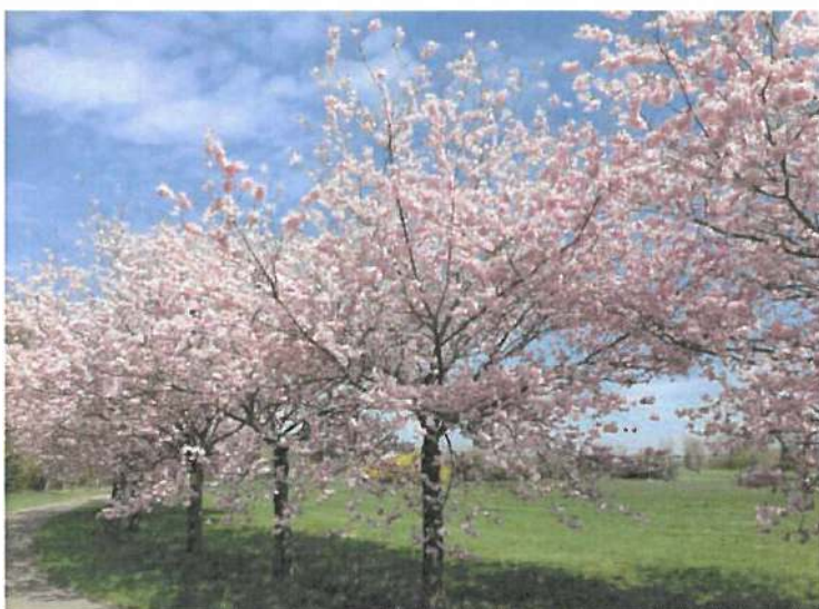
Obr. 6 Višeň chloupkatá 'Accolade'