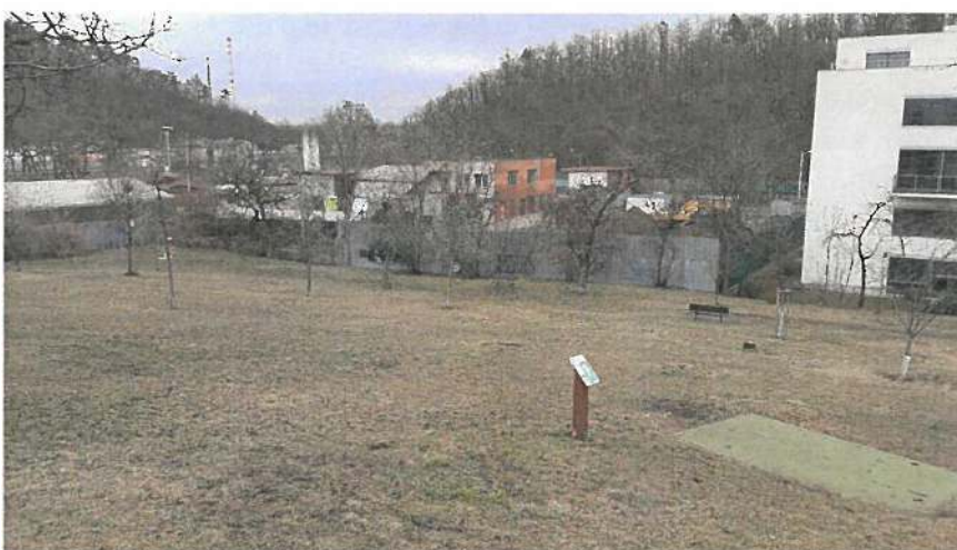
Obr. 2 Současný stav – jižní svah. Původní sad je postupně doplňován novou výsadbou.