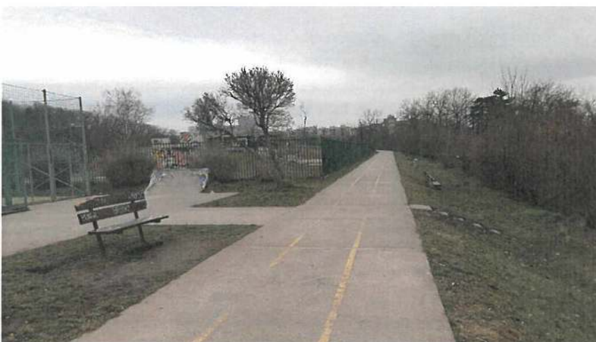
Obr. 3 Současný stav – vrch Kapitol s běžeckým oválem