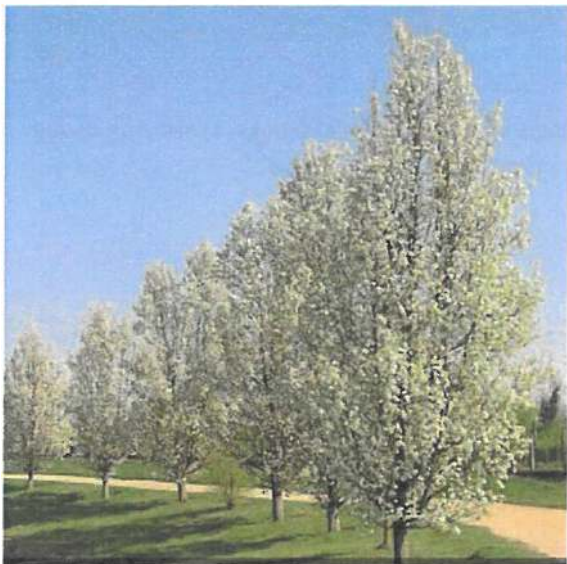
Obr. 8 Hrušeň Calleryova 'Chanticleer'