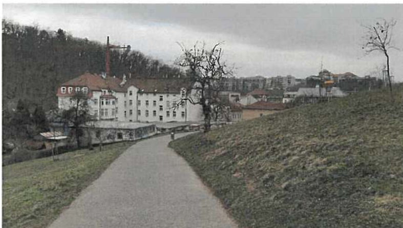
Obr. 1 Současný stav – přístupová cesta na vrch Kapitol z ulice Týmlova

Pro výsadbu byly zvoleny druhy ovocných a okrasných ovocných dřevin, které jsou vhodné pro daný typ stanoviště (plné slunce, spíše polosuché) a jsou u nás běžně dostupné v okrasných školkách. Tyto dřeviny při náležitě následné péči vytvoří dostatek zelené plochy a budou na stanovišti dlouhodobě udržitelné.