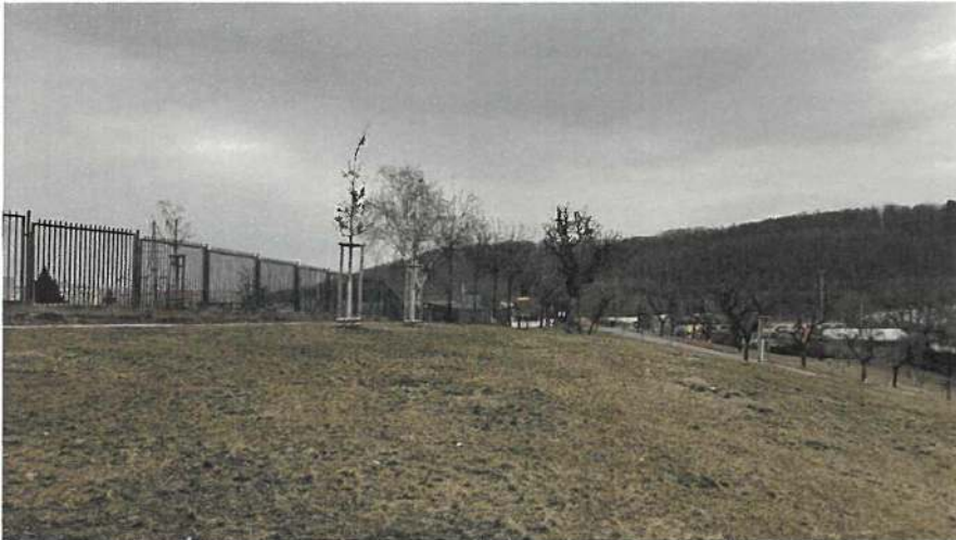
Obr. 4 Současný stav – mezera ve stromořadí