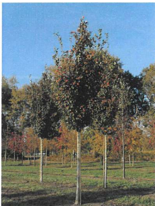
Obr. 9 Jeřáb muk 'Magnifica'