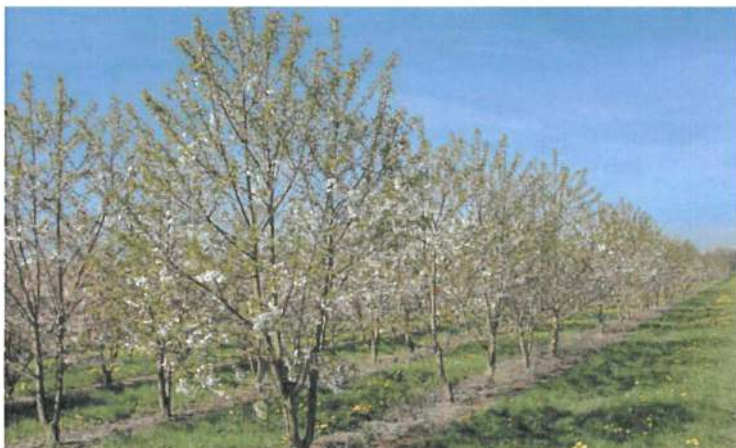
Obr. 7 Třešeň ptačí 'Plena'