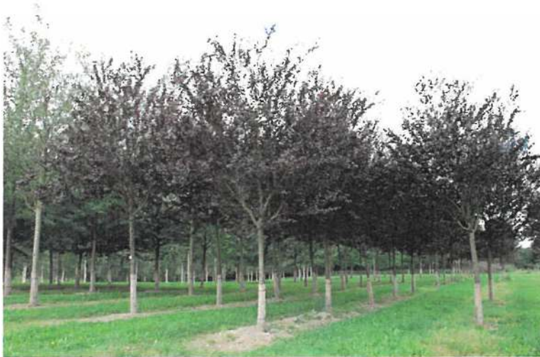
Obr. 5 Myrobalán třešňový 'Nigra'

Výsadbová velikost – obvod 14 – 16 cm, celkový počet: 1 ks Spon (rozestup mezi stromy) – 5 m