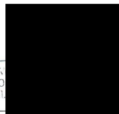
za zhotovitele Mgr. Petr Pjajko,