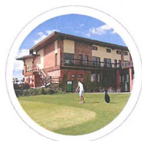
golf resort, hotel, restaurant Areál Botanika

www.arealbotanika.cz / www.golfbotanika.cz