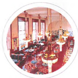
Kavárna Obecní dům Coffee house Municipal House