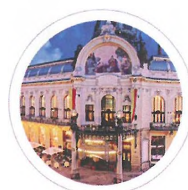
Catering v Obecním domě