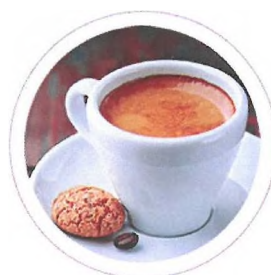
Café Rožmberský palác