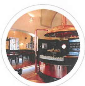
Pilsner Urquell Original Restaurant Malostranská beseda

www.arealbotanika.cz / www.golfbotanika.cz