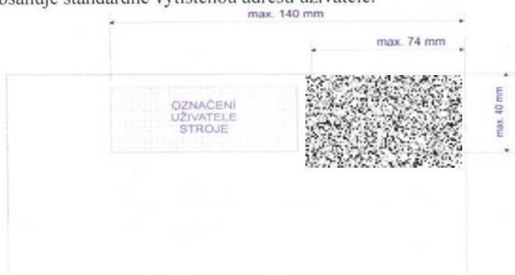
Obr. 1: Rozmístění otisku na zásilce

Označení uživatele, který stroj používá, je umístěno vlevo od otisku denního razítka. Jeho součástí mohou být logo, podnikové znaky i označení druhu zásilek. Obsah otisku musí být schválen ČP na základě smluvního vztahu. Označení uživatele může mít i propagační charakter, a to za předpokladu, že obálka obsahuje standardně vytištěnou adresu uživatele.