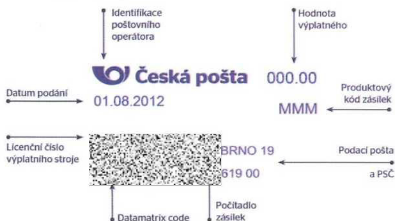
Obr. 2: Rozmístění informací na digitálním otisku

2D - datamatrix code obsahuje řetězec zakódovaných informací sloužící pro kontrolu a autenticitu informací o zásilce.