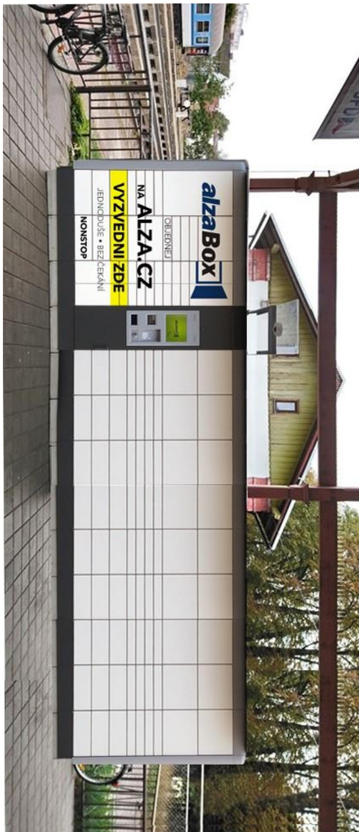
Příloha č. 3 vizualizace předmětu nájmu