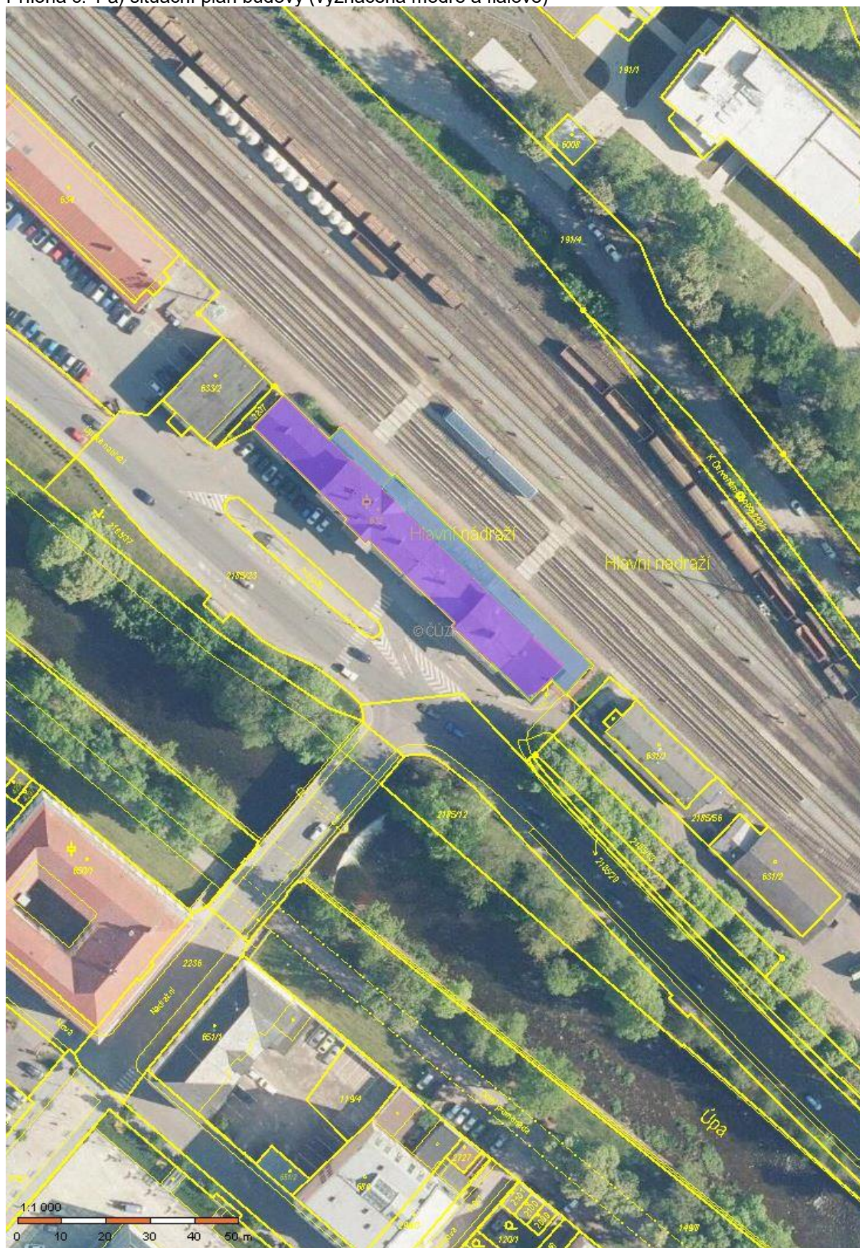
Příloha č. 1 a) situační plán budovy (vyznačena modře a fialově)