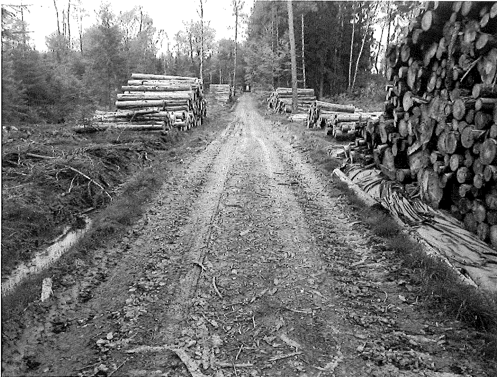
LC SV 338D