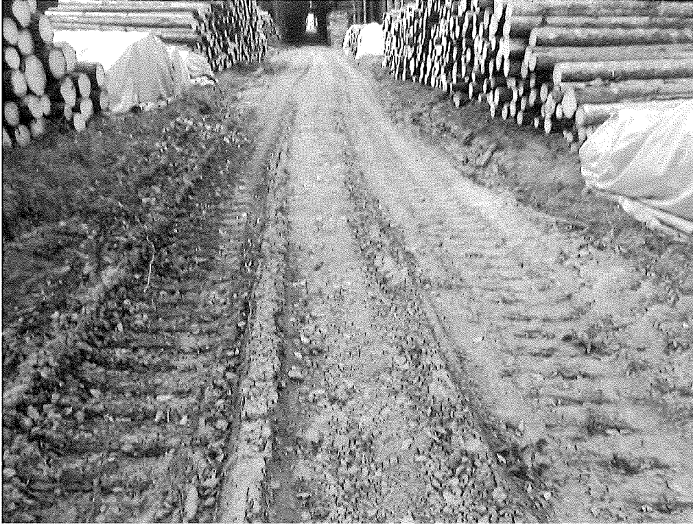
LC SV 339A