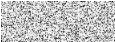
Pavol Pitoňák ředitel pro retailový obchod