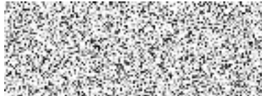
Karel Bláha ředitel pro korporátní obchod