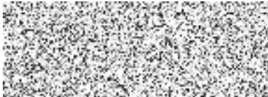
Pavol Pitoňák ředitel pro retailový obchod