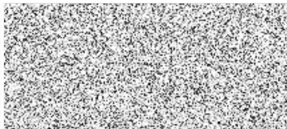
plk. Ing. Petr Stuchl náměstek pro ekonomiku KŘ PČR Ústeckého kraje