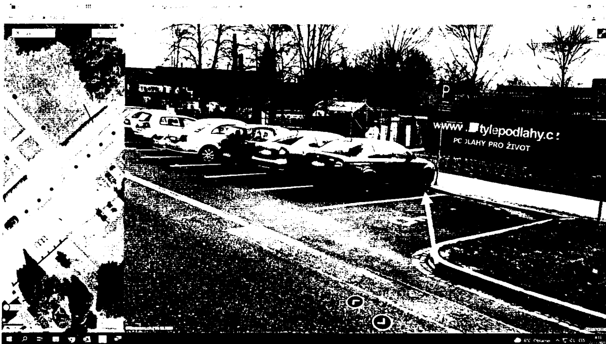
Ul. E. Rošického – 106 parkovacích míst, vždy v místě, kde auta zasahují do chodníku, vzdálenost 60cm od obruby