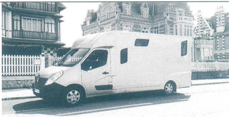
fotografie jsou ilustrační