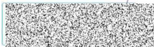
Zmocněnec (CENTROPOL ENERGY, a.s.)