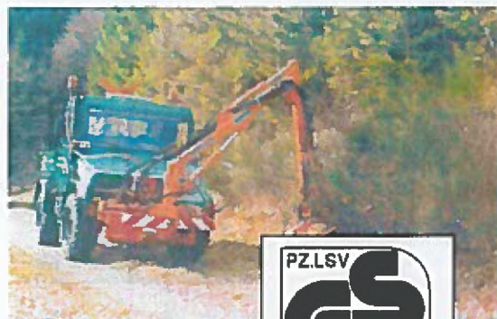
Messerwelle bei Gestrüpp