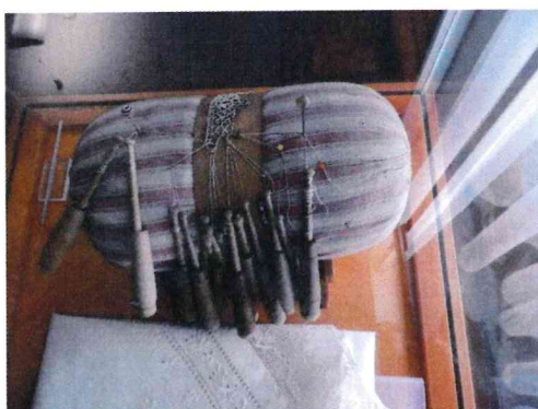
13. / - / -