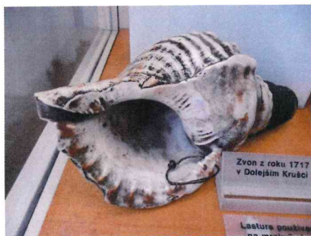
11. / 36.493 /-