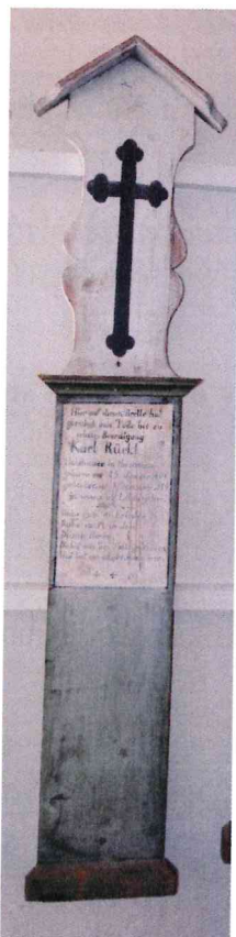
1. / 64/53/2 / -