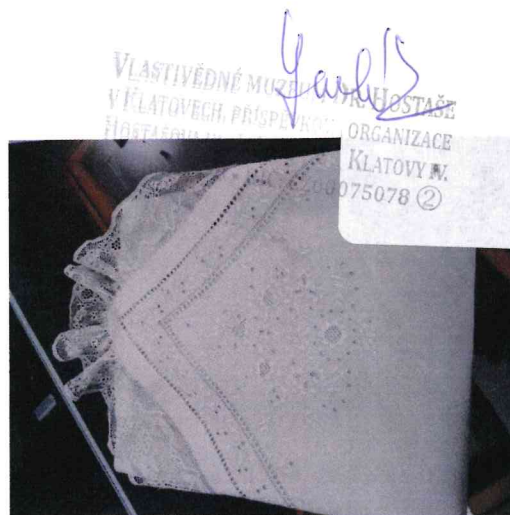
12. / 58.003 /-