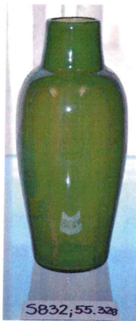
7. / 55.328 / S 832