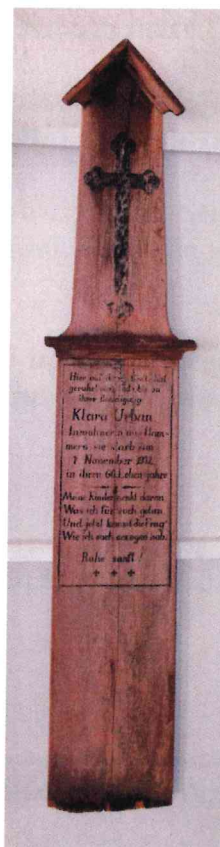
2. / 123/93/3 / -