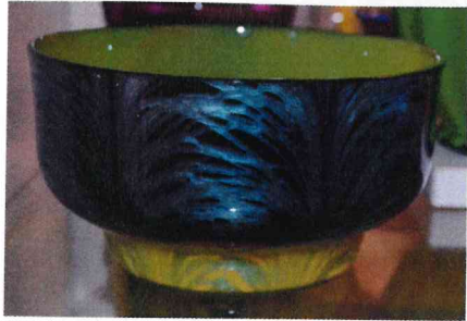
5. / 25.755 / S 844