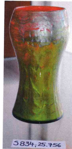
8. / 25.756 / S 834