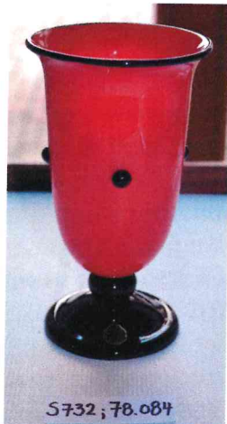
9. / 78.084 / S 732