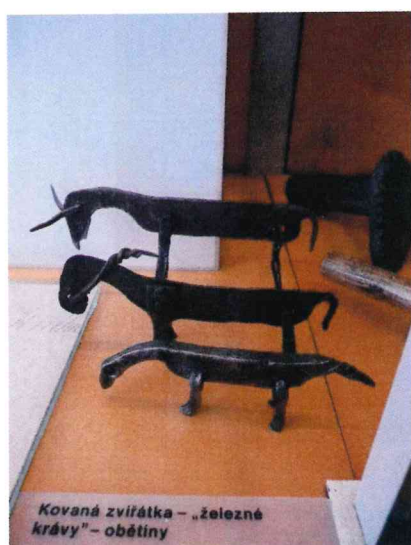
15. / 45.721 /-