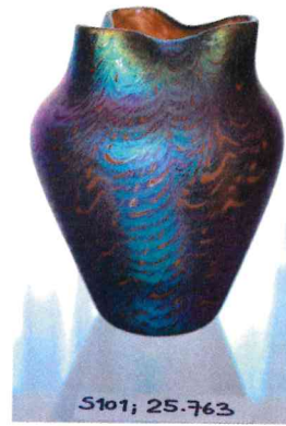
6. / 25.763 / S 101