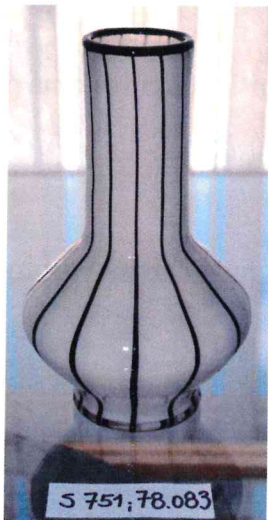
3. / 78.083 / S 751