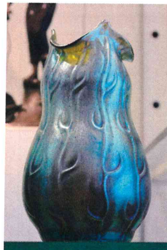
10. / 72/78 a.) / S 774/1