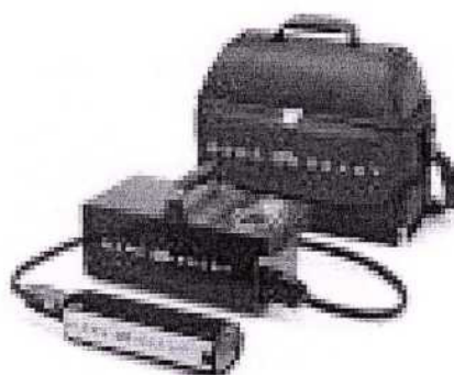
ilustrační foto: Přístroj pro chlazení