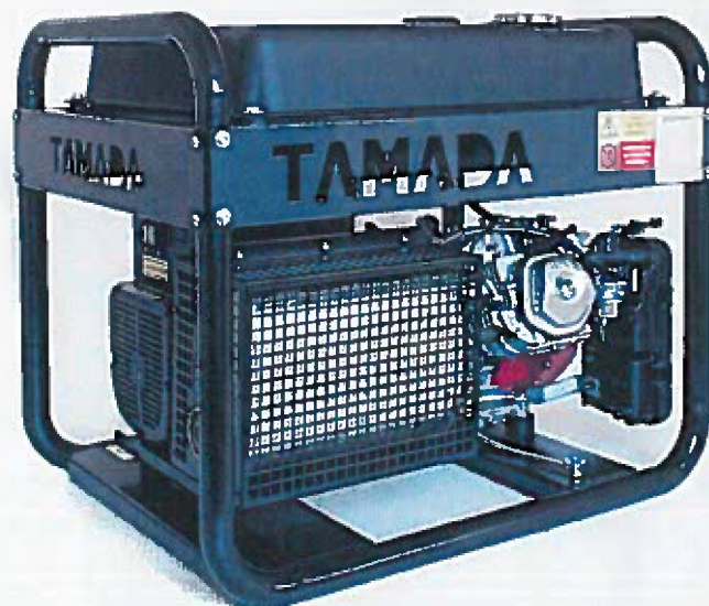
Obr. varianta s nádrží 40 lit.