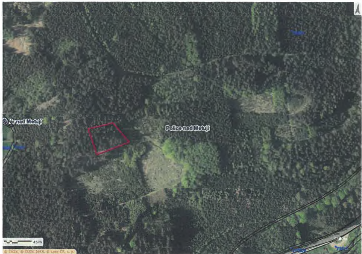
Mapa: K.ú Police nad Metují, p.č.715/1