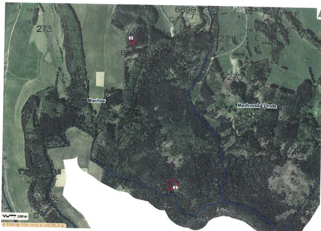
Mapa: K.ú Machov, p.č. 635 a 771/1