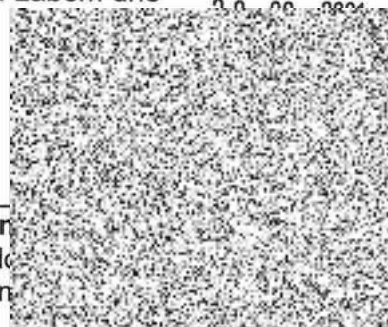
Ir vedoucí oddě n

ŘADY POLICIE ČESKÉ REPUBLIKY KRAJSKÉ ŘEDITELSTVÍ POLICIE ÚSTECKÉHO KRAJE POŠTOVNÍ SCHRÁNKA 179 401 79 ÚSTÍ NAD LABEM