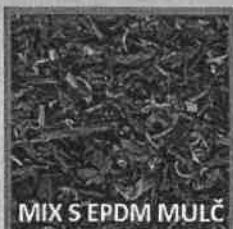
MIX S EPDM MULČ

Dopadové plochy SOFTNYX včetně herních prvků Lappset dodává ONYX wood spol. s r.o.