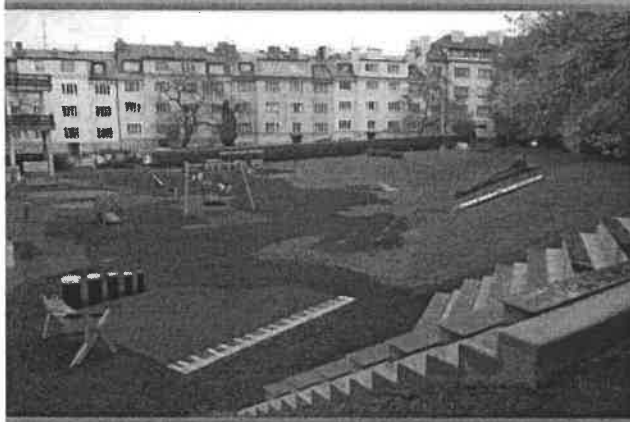
Ukázka realizace interaktivních vzorů do povrchu SOFTNYX