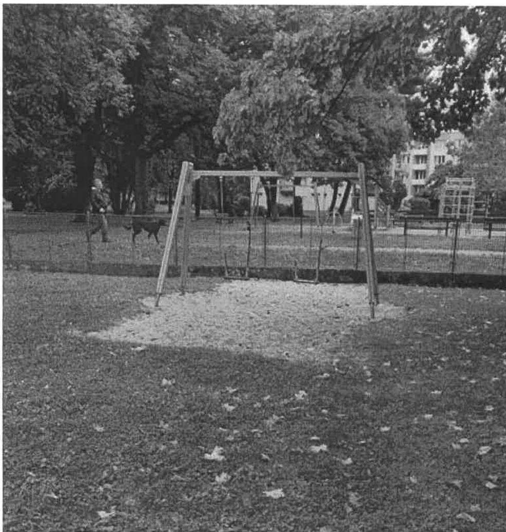
Stávající houpačka (020414)