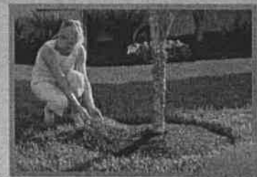
Ukázka využití v zahradní architektuře