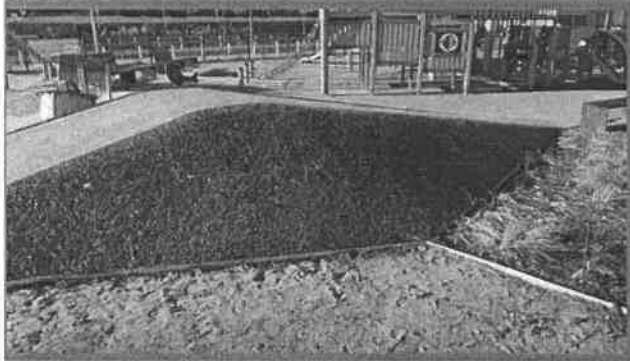
Ukázka realizace na nerovném terénu a svazích....