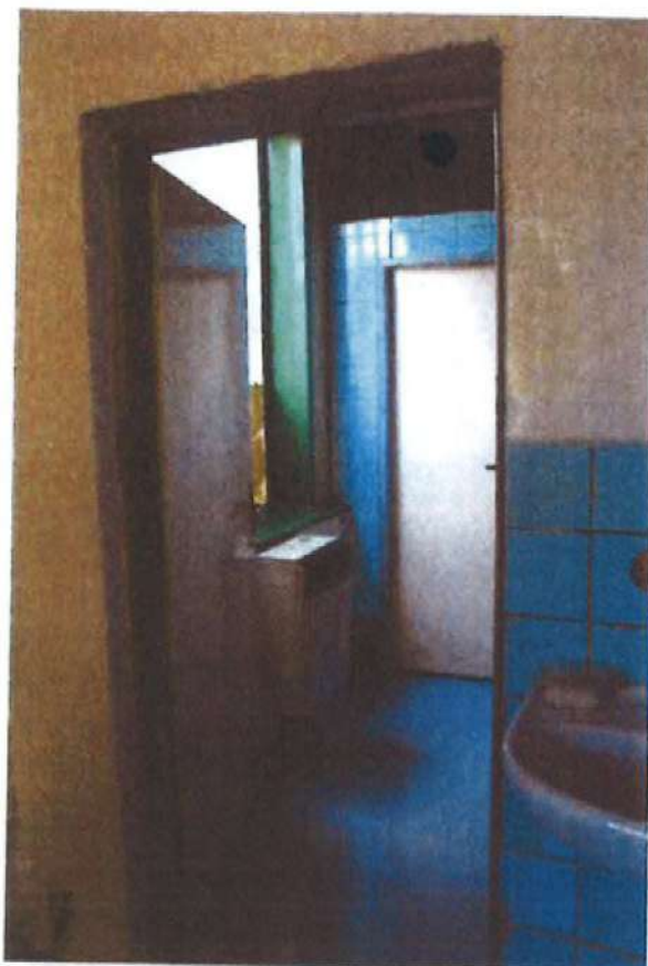
Zastaralá, netěsná okna