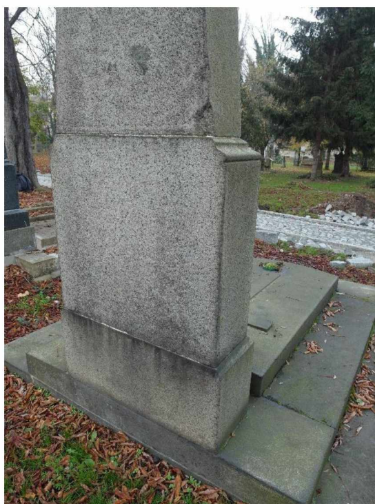
Náhrobek Dittrich , Olš. II, 5, 218, obelisk - stav v roce 2020