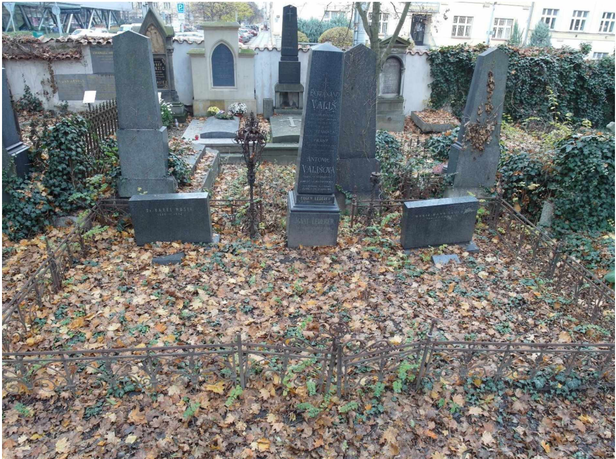
Náhrobek Vališ, Olš. III, 4, 333- stav v roce 2020