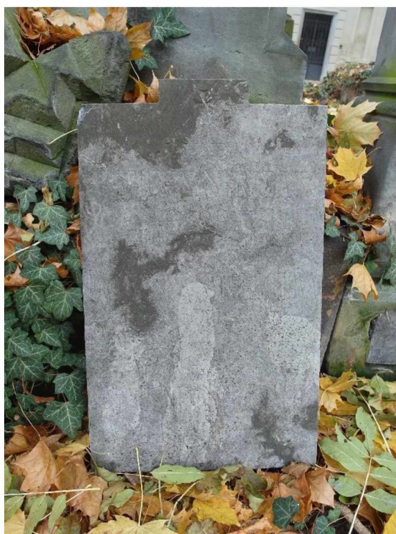
Náhr. Strobach , Olš. III, 6, 259, stéla Duras - detail prasklin, stéla Strobach nápisová deska, stav v roce 2020