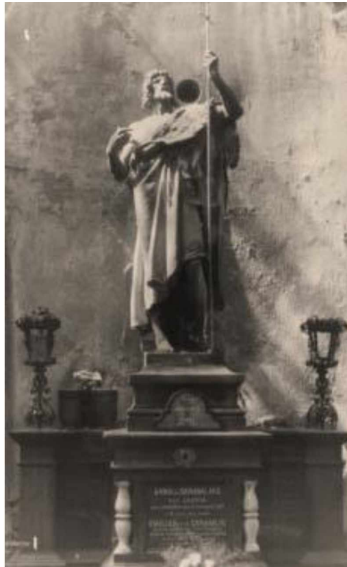
Náhrobek Skramlík Olš. VII, 23, 54c - historické fotografie sochy