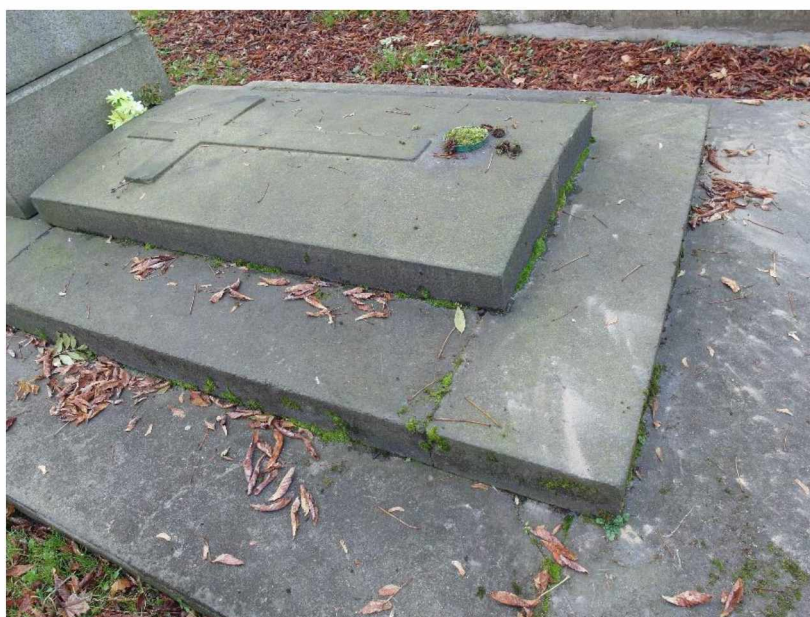
Náhrobek Dittrich , Olš. II, 5, 218, zakrytí hrobu - stav v roce 2020