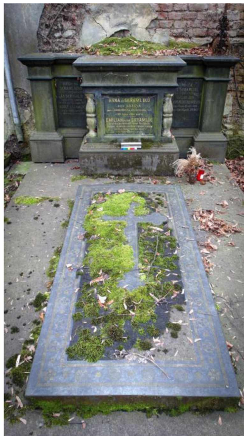
Náhrobek Skramlík Olš. VII, 23, 54c - stav v roce 2020