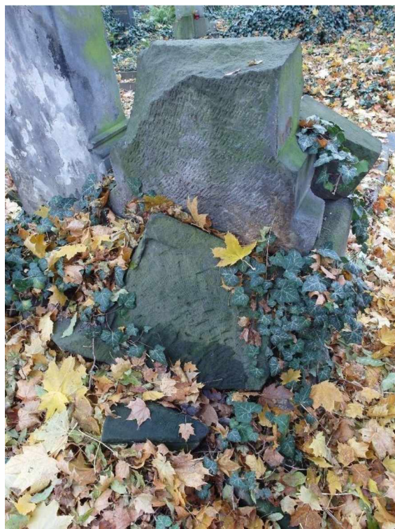
Náhrobek Strobach , Olš. III, 6, 259, dvojice stél, stéla Strobach zezadu, stav v roce 2020