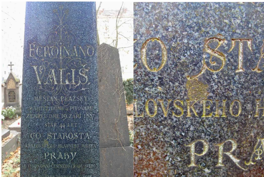
Náhrobek Vališ, Olš. III, 4, 333- detaily nápisu, stav v roce 2020