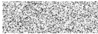
BÜROPROFI s.r.o. Tomáš Faltus, na základě plné moci