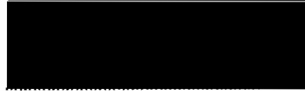
Pavel Pešek, vedoucí odboru obchodu, na základě plné moci