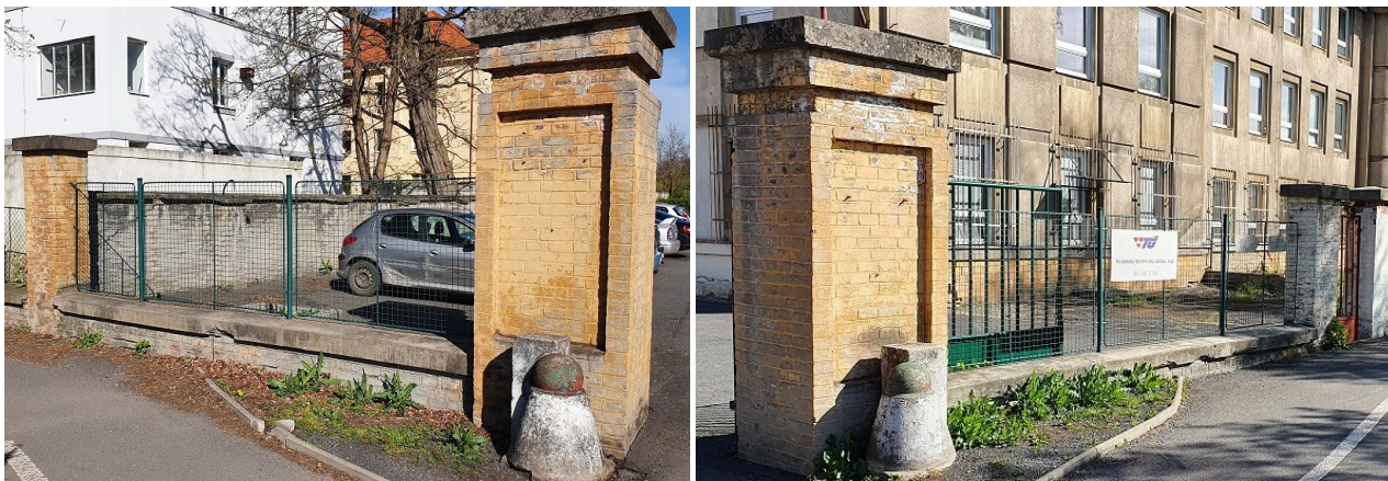
Rozměry křídel vstupní brány 3,5 x 2 m.

b/ nátěr stávajících plotových polí 4,05 x 1,6 m Celkem 67 ks.