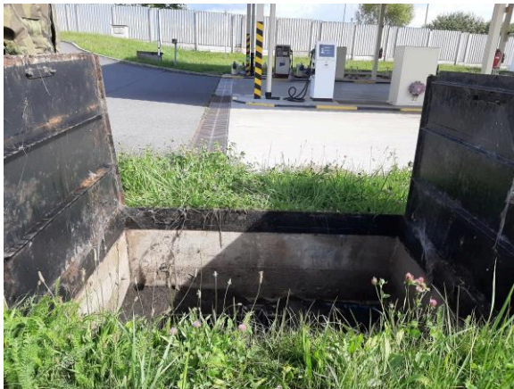
Fotografie č. 3 – lapol u PHM