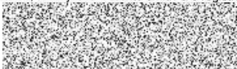
jméno, příjmení a podpis osoby pověřené pojistitelem uzavřením pojistné smlouvy

Tato smlouva nabývá platnosti v den jejího uzavření a účinností dnem 01.01.2022 00:00 hod. po uveřejnění v registru smluv dle zákona č. 340/2015 Sb., o zvláštních podmínkách účinnosti některých smluv, uveřejňování těchto smluv a o registru těchto smluv (zákon o registru smluv).