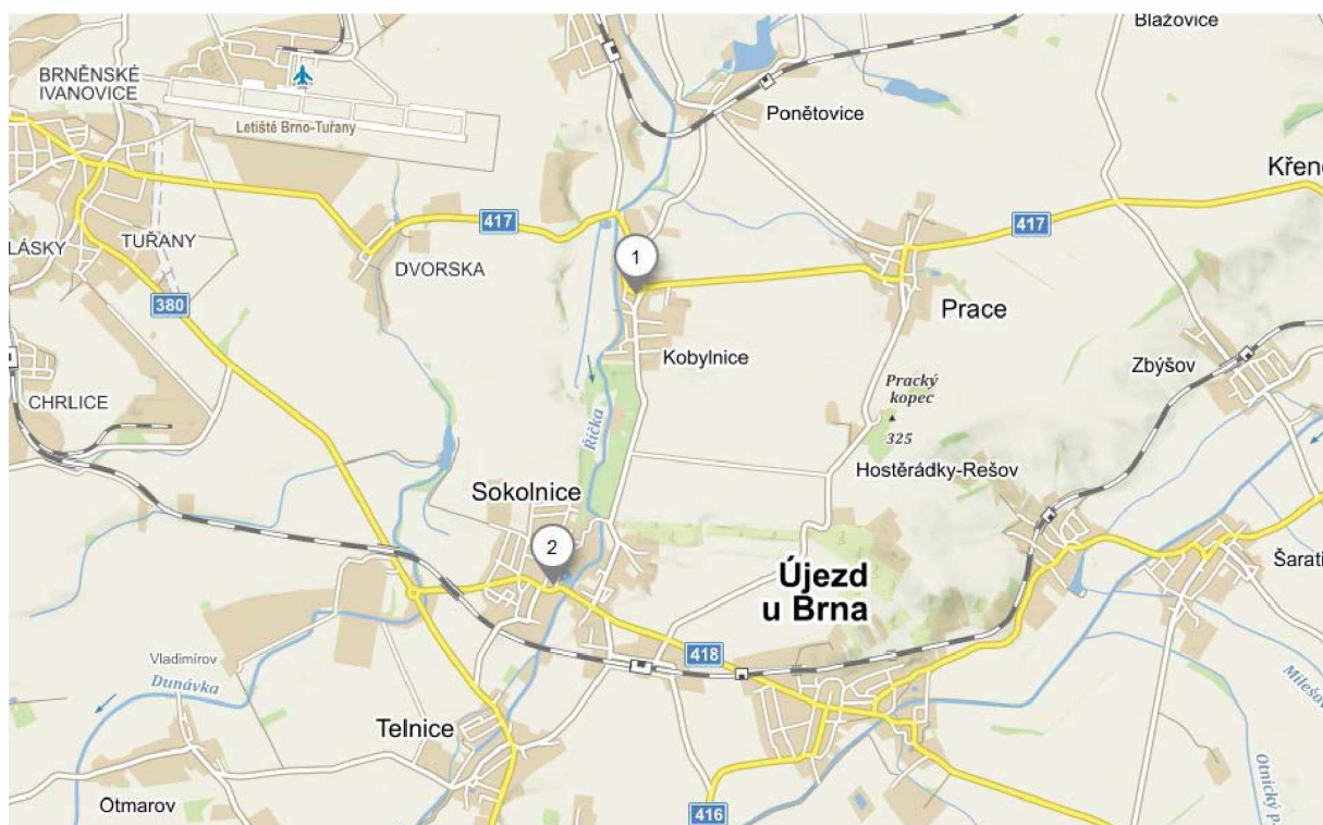
Obrázek 1: Obce zapojené do realizace projektu (www.mapy.cz).

Následný popis a analýzy jsou zpracovány pouze pro obce Kobylnice a Sokolnice, které jsou členskými obcemi DSO Šlapanicko a účastní se projektu.