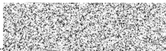
kupující (razítko a podpis)