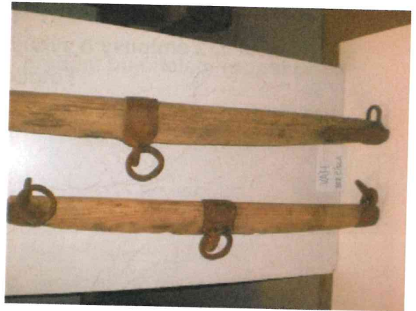
7. Váh do zápřahu koní