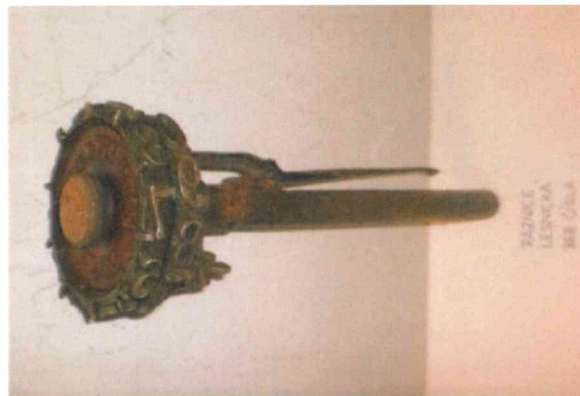
3. Ravnice na pokácené kmeny