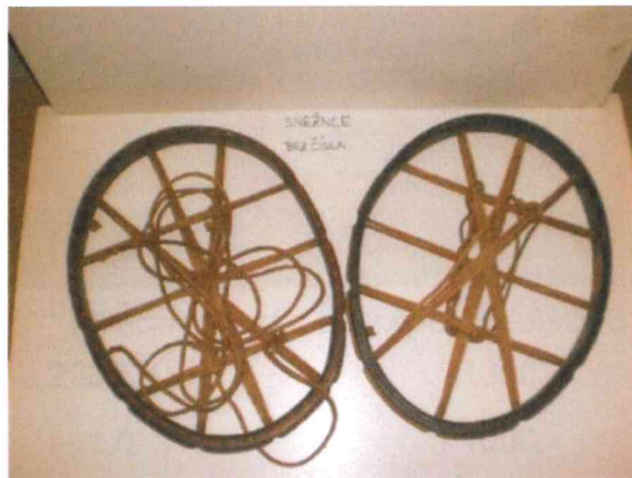
2. Sněžnice/pár 3 ks (2ks kulaté)