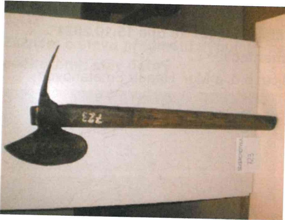
6. Sekeromotyka na sázení stromků