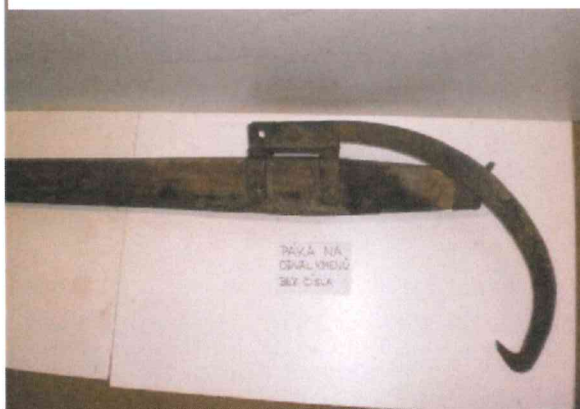
5. Páka na odval kmenů