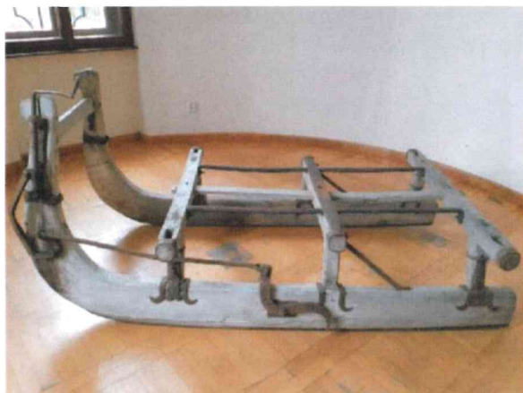
1. Dřevěné saně na svážení dříví