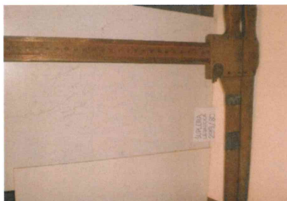
4. Šuplera lesnická