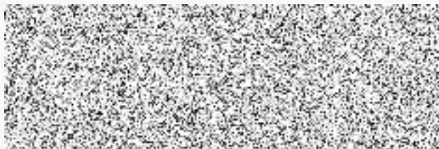
Mgr. Milan Vácha radní pro oblast vzdělávání a sportu

Při fakturaci uvádějte číslo naší objednávky, název projektu a registrační číslo projektu. Faktury bez tohoto označení Vám budou vráceny k doplnění. Splatnost faktury uvádějte minimálně 30 dní. V případě nepříznivé covidové situace proběhne seminář online formou.